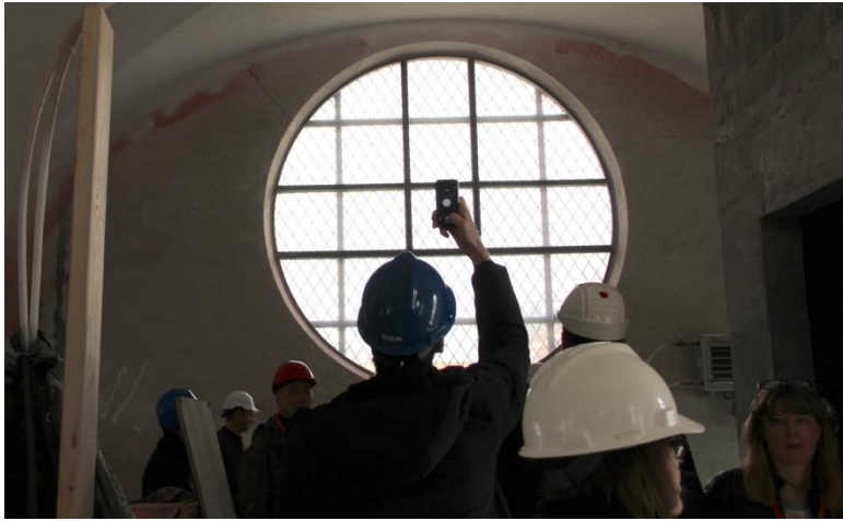
Kirkens smukke vinduer.