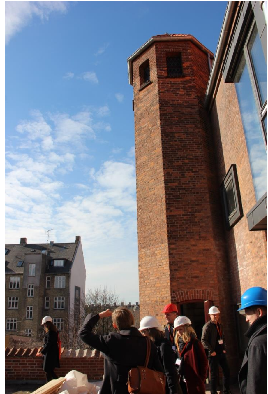
Klokketårnet og tagterrassen i forårssolens lys.