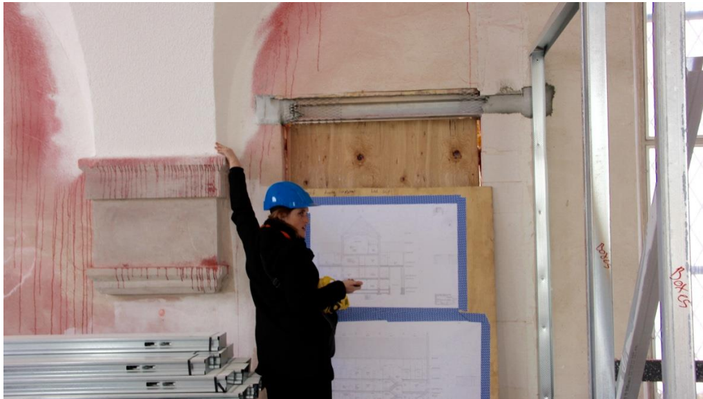
Kirkens øverste etage med smukke hvælvinger.